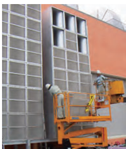
外壁面へのAEC型消音器の取り付け