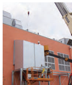
比較的小さいガラリは エルボ型消音器