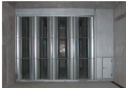
横シャフト設置のAEC型消音器