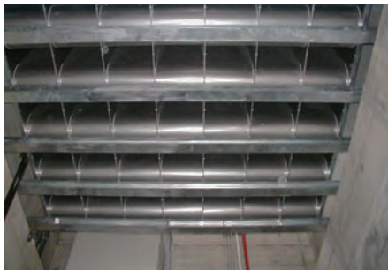
縦シャフト設置のAEC型消音器