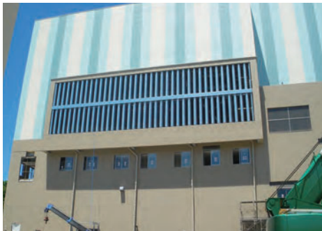
清掃センター換気口のAEC型消音器

地下駐車場・地下鉄などの給排気シャフト、 清掃センター・各種工場などの 給排気ガラリの消音