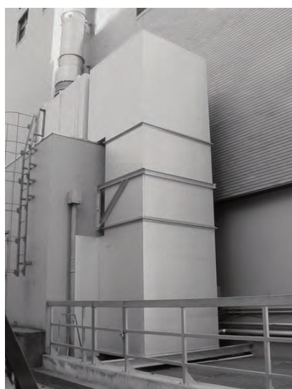
機械室からの排気ダクト用消音器