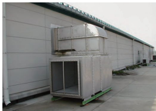
排気口用消音器 (排気に水分を含むため特殊吸音材を使用)