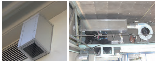
小径排気口用の消音器 (写真右は内部、AED型消音器)

ダクト接続の給排気口には、AEM・AEF・AEE・AEDなどのダクト系消音器が有効です。また、換気扇の消音には外側のフードに換えて、AEF・AEEを取り付けます。