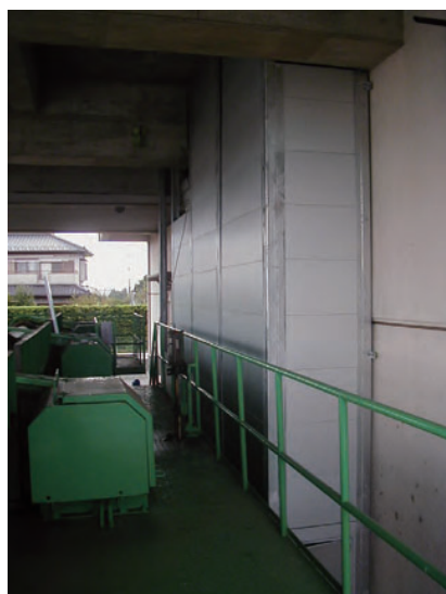
ポンプ場排気口に消音チャンバ