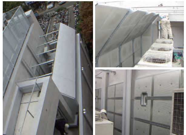
室外機置場防音壁 （防音壁の反対側の建屋壁にも反射防止のため防音パネルを設置）