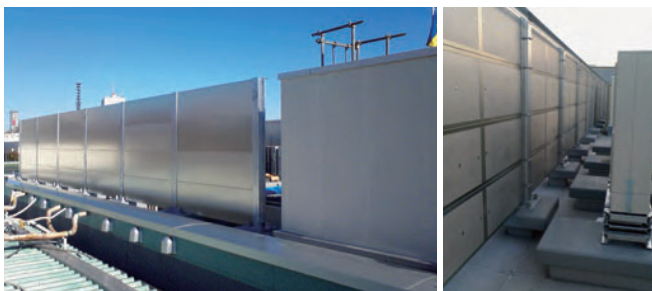
防音壁（防音パネル）の外面と内面