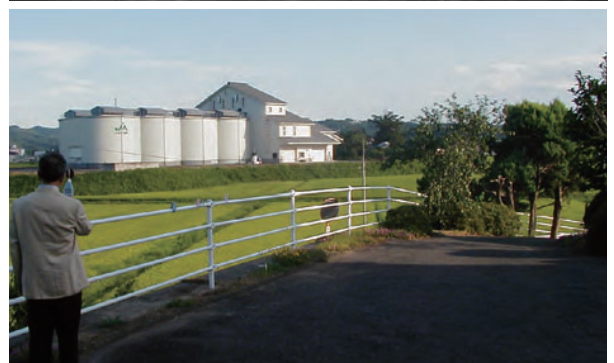
カントリーエレベーター上部排気口周りに防音パネル